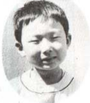
かぶともり ひろゆきくん おとうさんはオニゴッコしてくれる。