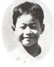
すがわら かずやくん あまりいっしょにあそべないけど好き。