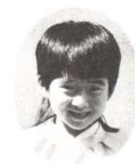
ふじわら れいなちゃん おこるとおっかないけどやさしいよ。