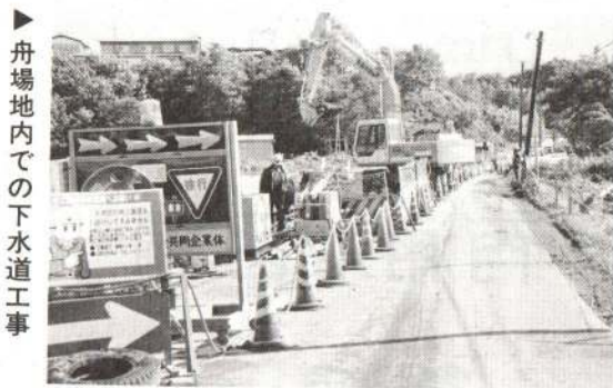
舟場地内での下水道工事

今回は、下水道課（建設部）と水道課をご紹介します。下水道課は機構改正により新設されたものです。