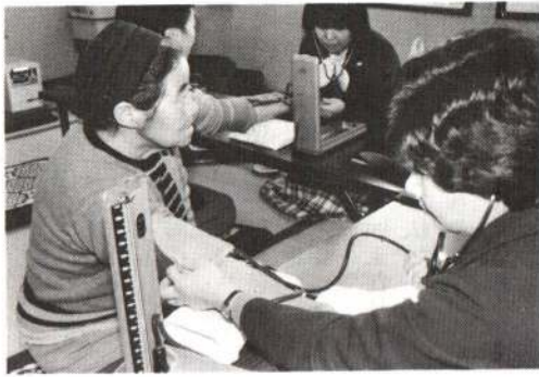
▶ 定例の健康相談 (矢立公民館)