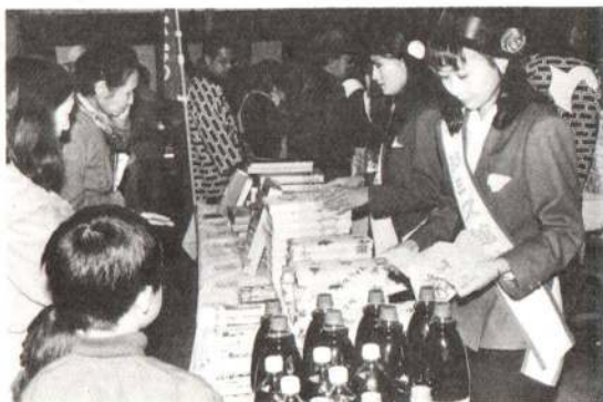
▶館林特産品コーナーでは、ミズ館林が来館し、特産品を紹介。