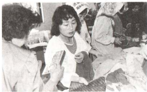
◀婦人会館まつりのバザーでは一時間で品物が売り切れ。