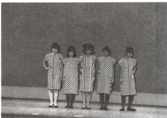
▶華やかなステージ、ファッションショー。