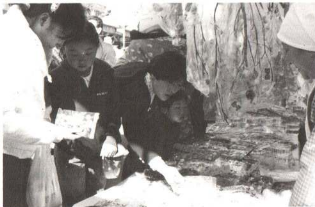
▲枝アメやエトの細工アメを買求める人たちが大にぎわい