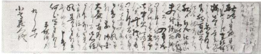
▲『鳩裕平賀源内書』平賀源内自筆の書簡(大館市立中央図書館蔵)

天下の奇才平賀源内が沼館村(現大館市沼館)に入った。当時、佐竹藩では藩財政政策の一つとして、鉾山開発と精練法改良を図っていたが、そのために招聘したのが、平賀源内と吉田理兵衛であった。兩名は同年七月十二日に院内に入り、のち久保田、阿仁そして源内は前述の沼館村に入った。