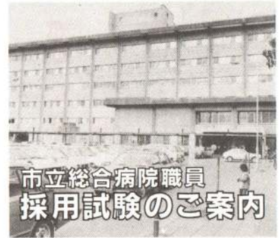
市立総合病院職員採用試験のご案内

〈試験区分・採用予定人員〉 看護婦(士) 若干名 診療放射線技師 若干名 薬剤師 若干名 〈受験資格〉