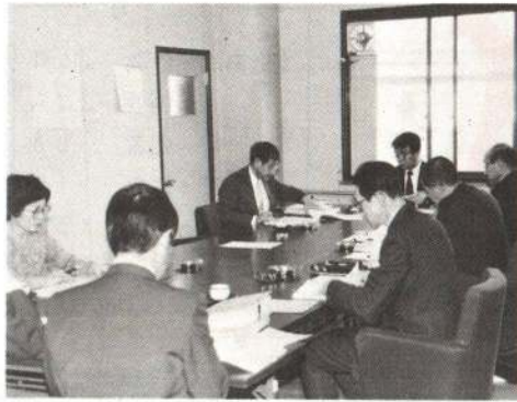
▶第一回目の保護委員会(一月三十日)

条例では個人情報を「個人の生活事項に関して特定の個人が識別され、または識別され得る情報」としています。つまり戸籍や経歴、心身についての情報、財産や思想・信条などに関する情報、その他家庭の状況や社会活動状況など(生活事項)から、あの人だと分かっていたり、これらの情報を組み合わせること、その人だと分かっていたりする情報のことです。