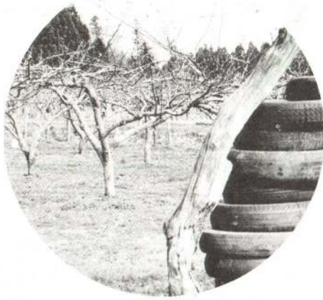
果樹園では霜の害を防ぐために古タイヤを燃やします。

冷害は、過去の例をみると二年連続して発生することが多く、戦後だけをとってみても昭和二十八年・二十九、四十年・四十一年、五十五年・五十六年と三回もありました。「巳年のけちち」と