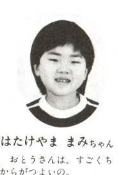
はたけやま まみちゃん おとうさんは、すこくちからかつよいの。