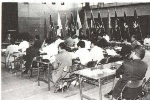
▶連絡協議会設立総会

詳しくは、市体育課内「地区体育・スポーツ振興会連絡協議会事務局」☎42103110へお問い合わせください。