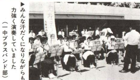
▶みんな汗だくになりながらも力強く演奏していました（一中ブラスバンド部）