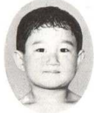
しらかわゆうやくん かみのかたちがかっこいいんだ。