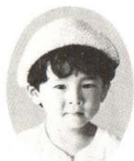
さとゆうすけくん おとうさんのおめがだいすき!