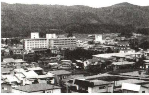
蘇生事業が行われる大滝温泉

うな事業に充てるべきかについて、各方面からアイデアを出していたがこうと、市民アイデア会議などを開催。その結果、庁内アイデア六件、市民アイデア四十三件の計四十九件が出されました。