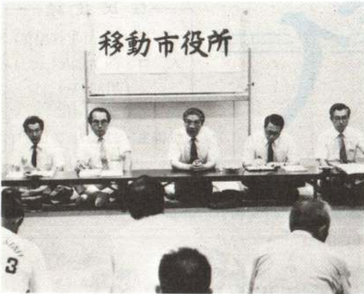
▶8月23日の根下戸会館会場

二井田、真中、下川沿地区の順に、一日各地区とも二会場（花矢地区は二日で四会場）の計十六会場で開催されました。開催最初の花矢地区、四会場の一場平均出席者数は、約二十五人で出足は好調でした。その後開催した地区では花矢地区ほど多くはありませんでしたが、まずまずの出席者数でした。