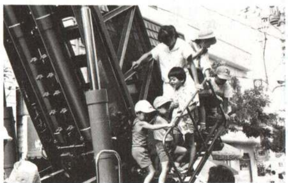
▲全県一ノッポなハシゴ車に乗って、子供た ちは大喜び

夏のフィナーレを飾る“大館大文字まつり”が8月16日行われ、約17万人の人出でにぎわいました。