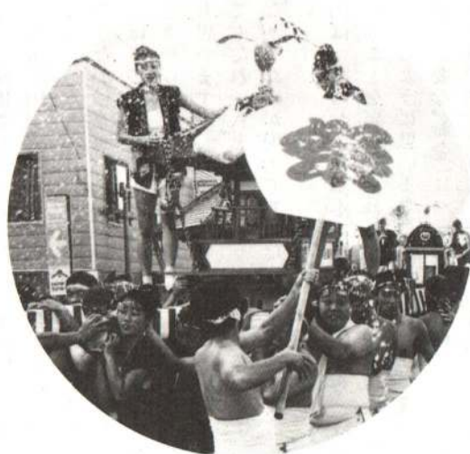
▲迫力満点！ぶっかけみこし