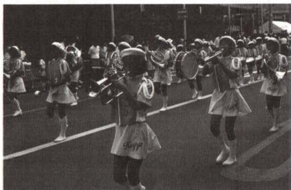
▲軽快なリズムでお祭りムードを盛り上げた、 小学生によるゴールデンパレード