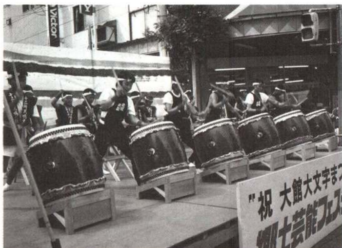
▲大町の特設ステージで、十二所天鳴太鼓の 子供たちが力強いばちさばきを披露