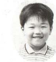
さとう まなぶくん また、おんせんへつ れてってね。