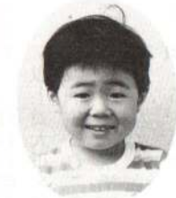
くりもり こうくん いつもやさしいけど おこるとこわいよ。