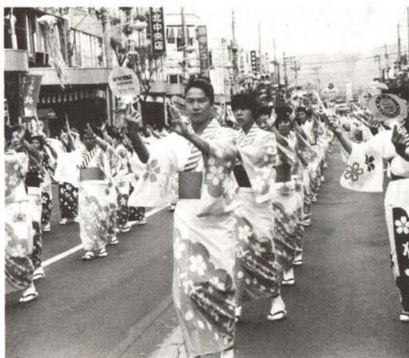
▲華麗な踊りで、沿道の観客を魅了した 大文字おどり