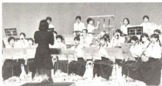
◆ 楽しく学ぶ集いに参加した、下川沿中吹奏楽部・大館幼稚園の皆さん