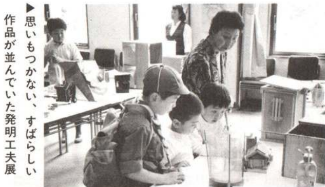
▶ 思いもつかない、すばらしい作品が並んでいた発明工夫展

9月15日から17日までの3日間、第14回大館市「教育の日」が市民文化会館を主会場に開催されました。