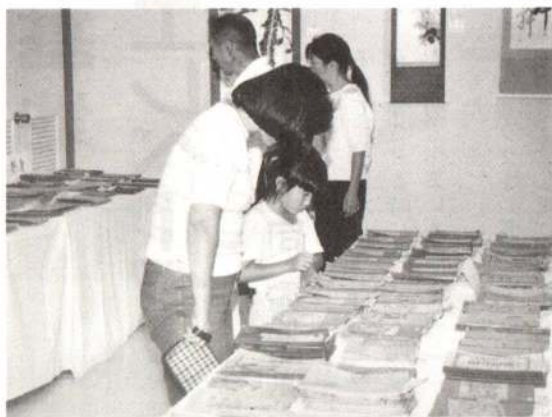
◀ 昔の教科書や通信簿を見て、何を感じているのかな？

また、3日間通して行われた昔の教科書展や発明工夫展なども、大勢の人でにぎわいました。