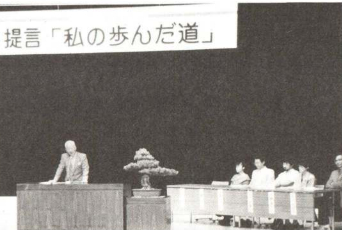
▲ 今年初めて行われた提言集会！ 6人の市民が、「私の歩んだ道」について、力強く発表しました