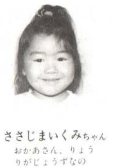
ささじまいくみちゃん おかあさん、りょうりがじょうずなの