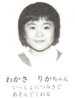
わかさ りかちゃん いっしょにつみきてあそんでくれる