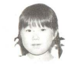
みうらみさきちゃん おとうさんはしごとでいそがしいよ