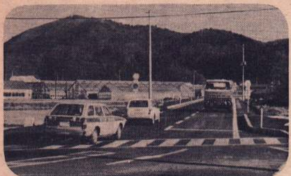
国道103号線山館地内バイパス