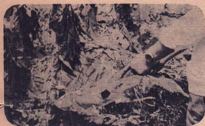
降ヒョウによる被害