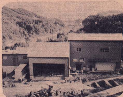
広域ゴミ処理施設