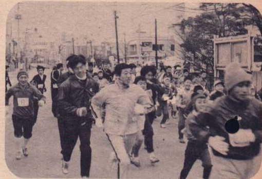
1月1日市民元旦マラソン