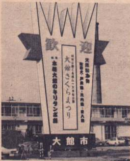
駅前広場に建てられた歓迎塔

が12.5m、幅は最小4.7m、最大7.7mで、塔の先端の形は、農業、商業、工業、林業、鉱業の5大産業の発展と振興を表現し、横にひろがる部分は大館の大を表わしたものです。