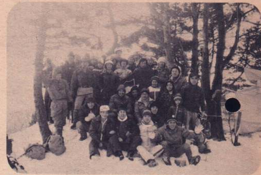
1月1日 鳳凰山市民元旦登山

同地下道のすぐ北側には、一昨年10月に完成した太鼓橋もあり、桂城公園や市民体育館を訪れるときは、路上横断での自動車事故の心配は全くなく、国道7号線の上と下を通行できるようになったわけ