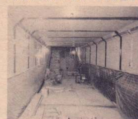
事故と犯罪の防止が考慮されている地下道内部

全長が63m、幅3m、高さ2.5mで、出入口は階段のほかにはスロープ状に傾斜がつけられているため、自転車の手押し通行も可能となっています。また、通路には冬期間通行の際のスリップ事故防止のための融雪装置や防犯用非常ベルとランプも設置されています。