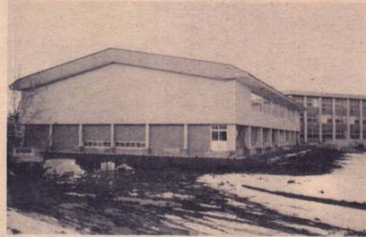
完成した一中体育館

っており、この工事が完成すると、同校の新築事業の全てが終了することになっています。