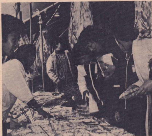
113店の出店は「ウジになるまい、カゼひくまい」とアメを求める客でいっぱい