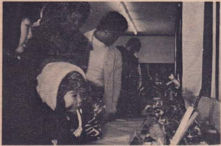
「工芸アメ展示コンクール」形・色彩に観客もウットリ