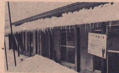
急ピッチで工事中の身体障害者用住宅