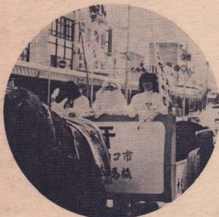
白髭大神とミコの馬ソリも行事を盛り上げる

400年前からの伝承行事「アメッコ市」が今年も2月11、12日の2日間開催されました。行事が復活して今年が9回目、いままでにない好天に恵まれ、人出アメの売上げも史上最高の記録とのこと大盛況のうちにその幕を閉じました。