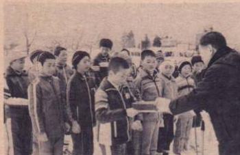
競技終了、教育長から表彰を受ける豆選手たち

温のしかも毎分110ℓと豊富な湯量も確保されるなど、縁に囲まれた温泉つきのすばらしい休養施設が、今年7月にはオープンされることになっています。