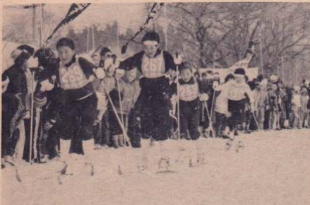
寒さも吹き飛ばす選手たちの力走