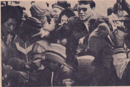
「アマ酒サービスコーナー」も大盛況