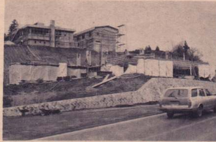
7月オープンをめざし工事中の矢立ハイツ

建設地は、美しい秋田杉の自然林に囲まれており、その自然を活用した散策路も設置、また、温泉ボーリングにより適