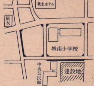
■の部分拡幅の予定

画では、道路の改良については、着工前に工事道路として、城南小学校両脇から中央公民館への市道2本は、出入口を隅切工事で一部拡幅、さらに同小学校裏、中央公民館前の市道桜町線延長1077mについては、現在の幅員を3m拡幅して9mとすることになっています。また、