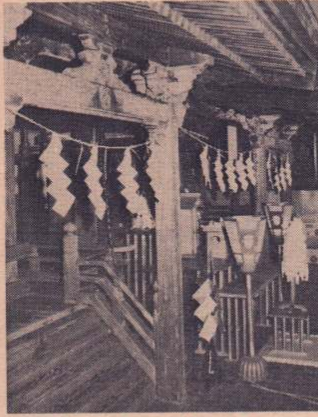
八幡神社神殿、手前が小八幡、奥が大八幡

この神殿は、万治元年（一六五八年）に建てられたもので、大館城中の鎮守でした。真屋の四柱の中心と中心を計ると、大八幡が二・〇三呎×一