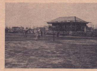
オープンした「テニスコート」

完成したテニスコートは、昨秋から総工費三千三百万円で造成して来たもので、クレーコート四面と雨天の日のゲームも可能な全天候型コート一面の計五面です。