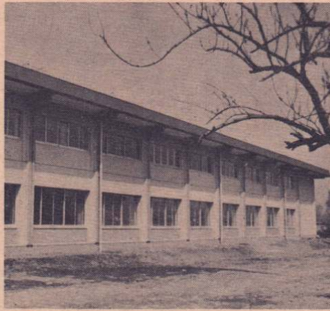
完成した市立総合病院「放射線棟」