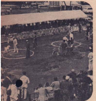
秋田犬展 — 4月29日、5月3日