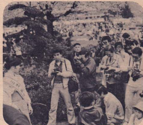
「ミス観光大館撮影会」—5月3日