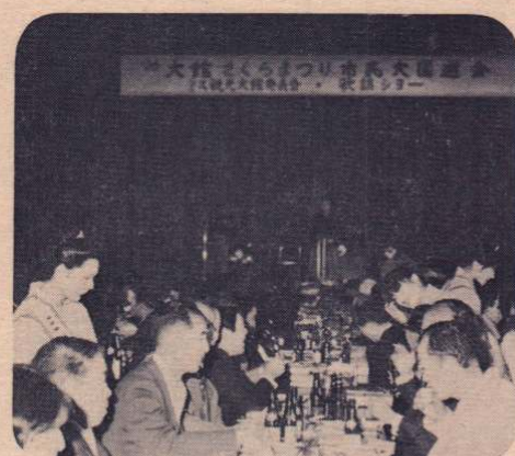
約650人が参加しての「大園遊会」 — 4月27日