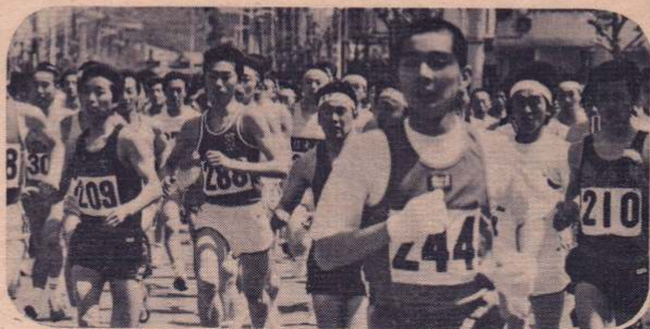
480人の力走「山田記念ロードレース」—4月29日

町内の中に、有浦小学校、東中学校などがある、いわゆる文教地区でもあり、また交通の便にも恵まれているため、まだしばらくは「新入りさん」も後を絶たない様子。それだけに、荒けずりな面がある反面、将来へ向けてのいろいろな魅力を秘めた町内でもあるといえます。