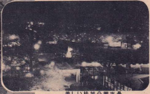
美しい桂城公園夜景