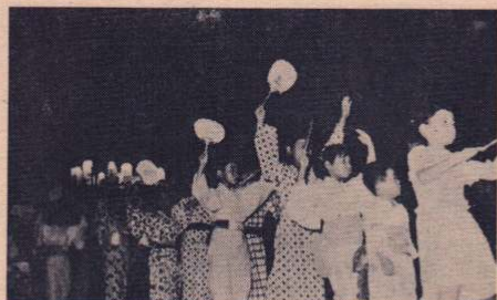
灯籠に彩られた盆踊り

大館盆地のほぼ中央部、西側を国道7号線バイパス、北側を私鉄小坂線と接する有浦町内会は、有浦一・二・四・五丁目がひとつになってきた、いわば連合町内会です。