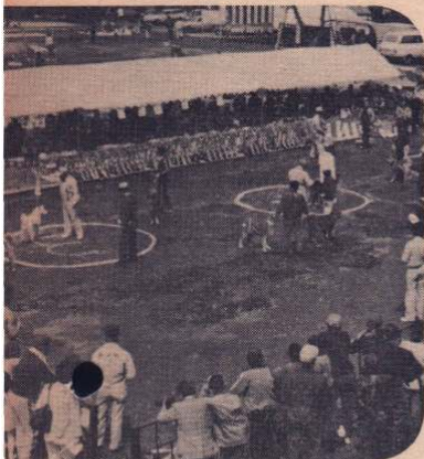
秋田犬展 — 4月29日、5月3日