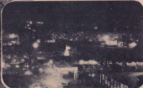
美しい桂城公園夜景