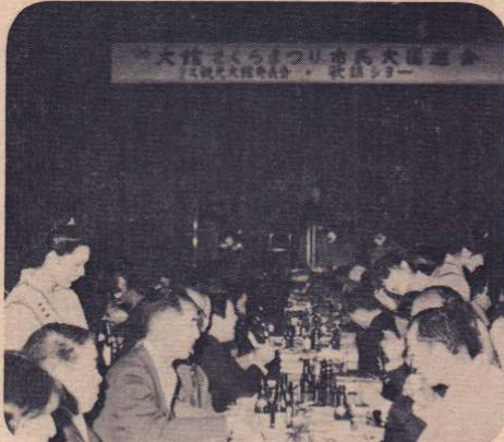
約650人が参加しての「大園遊会」 — 4月27日