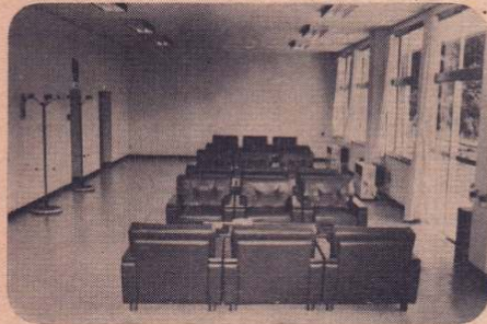
完成した 三十五畳敷の「和室」 「管理棟」 広々とした「ロビー」