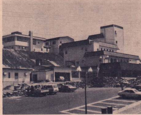
6月19日オープンの「矢立ハイツ」