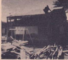
解体が始まった矢立保育所

現在の長木公民館は、昭和三十年に古材を利用して建てられたもので、その一部は老朽化が著しく、また、地域の社会教育活動の活性化に伴い手狭になりました。 十分な公民館活動が出来ないのが現状です。こうした理由から地区の方々からの強い要望もあって今回の新築に踏み切ったのです。