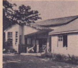
新築される長木公民館

市では、重点施策のひとつである文教施設などの整備に積極的に取り組んでいます。現在、長木小学校の新築事業を進めています。先月長木公民館新築事業をはじめ、矢立保育所の全面改築工事など五施設の工事を発注しました。また、工費が九千万円を超える保健センター新築工事と長根山運動公園の陸上競技場建物本体工事については、六月定例会議で議決された後に着工することになっており、これら七施設の工費の総額は約四億二千万円になります。 この中から長木公民館新築事業と矢立保育所改築事業についてお伝えします。