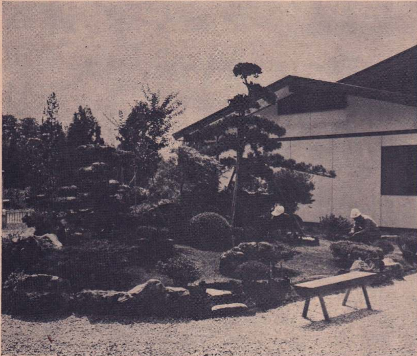
老人いこいの家正面広場に完成した庭園