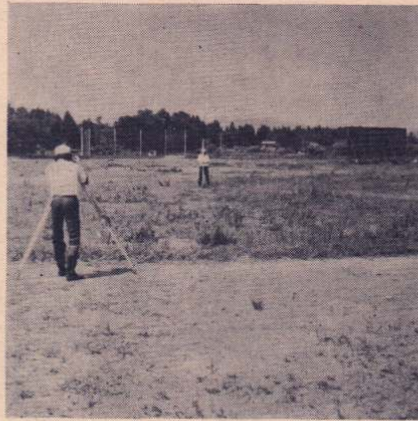
運動場が建設される旧二井田中学校跡地 写真真実は53年にオープンした二井田球場

二井田地区には工業団地が配られており、現在は、一社が換装、一社が工場を建設中ですが、今後さらに企業の進出を図るため、工場に働く従業員、さらには屋外スポーツの盛んな地区住民のために以前から運動場の設置を計画、このほど国から二井田野球場の建設地は、昭和五十三年にオープンした二井田野球場の東側に隣接する旧二井田中学校跡地約一万二千五百平方㍍と、さらに同地南側に隣接する二井田産区から市に無償譲渡された約二千五百平方㍍、合わせて約一万五千平方㍍の土地で、同運動場は、一周が三百㍍の