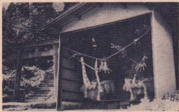
部落を見守る仁王様

市の北部、下内川沿いに縦走する国鉄奥羽線の上り線と下り線にちょうど挟まれるように位置する〆松原地区〆は小高い山と田畑に囲まれた世帯数66戸、人口274人の純農地区です。