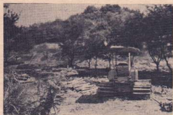
地域住民の要望に応え 造成中の十瀬野公園墓地

市では、花園地区にある十瀬野公園敷地内に、さらに九十六区画の墓地を造成中です。同墓地は、昭和二十五年、旧花矢町時代に建設されたもので、市に合併後の四十九年には七十二区画の拡張が行われており、現在、約二百八十基が設置されています。しかし、拡張時には分譲希望者が多く、五十五人が抽選もれとなつていことなどから、その後も地域住民の間で墓所拡張の要望が強く、このたび再度、墓所の拡張をすることになったものです。造成面積は六千二百二十平方㍍で、一区画六・四八平方㍍、墓所が九十六区画増設されるものです。