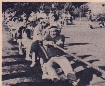
力自慢が勢ぞろい