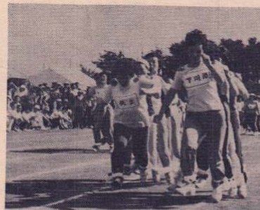
足なみそろえてイチニ、イチニ……