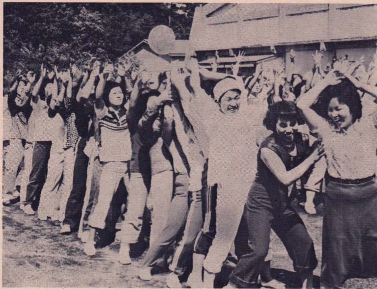
ママにならないボールにお母さん汗だく!!

会場の大館商業高校グラウンド には、市内十三地区の幼児から 老人まで約二千人が参集、この 市民運動会は、これまで各地区 で行われてきた運動会を、全市 り各種目に熱戦が繰り広げられ