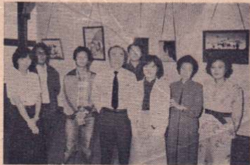
はじめての作品展会場で

中央公民館で主催する市民学校のひとつから生まれたガラス絵のグループ「グラス・アート」。発足してまだ一年足らずの新しいグループですが、9月21日には待望の作品展を中央公民館で開くことができました。