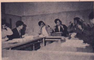
手話劇の台本読みをする皆さん

聾啞者の意志伝達の手段として行われているものに、口話法と手話法のふたつがあります。そのうちのひとつ、手話法の学習と研究、さらに広く普及させるために活動しているグループ「大館手話研究会」を紹介いたします。