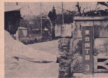
住居表示板の取り付けも終了した東台地区

(ひがしだい)一丁目」から「東台七丁目」に「字金坂」や「字金坂後」や「字東台」の一部の区域が「赤館町」(あかだてちょう)になりました。 この住居表示の実施により、行政や郵便配達業務に家を探ね当てる時などに「いんわたりやすくなり、地区の方からたいへん喜ばれています。 これからは、年賀状を差し出すシースに「新しい住所」になります。新しい住所で出すようにしてください。 住居表示について不明な点がありましたら市民課記録係にお尋ねください。