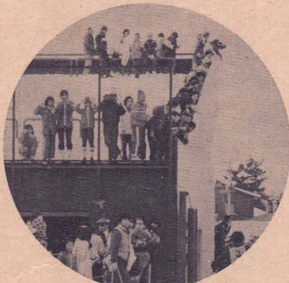
球場のスタンドはかけつけた父兄の応援席と早変わり