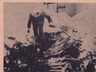
越冬ネギの掘り出し作業 (十二所曲田地区)