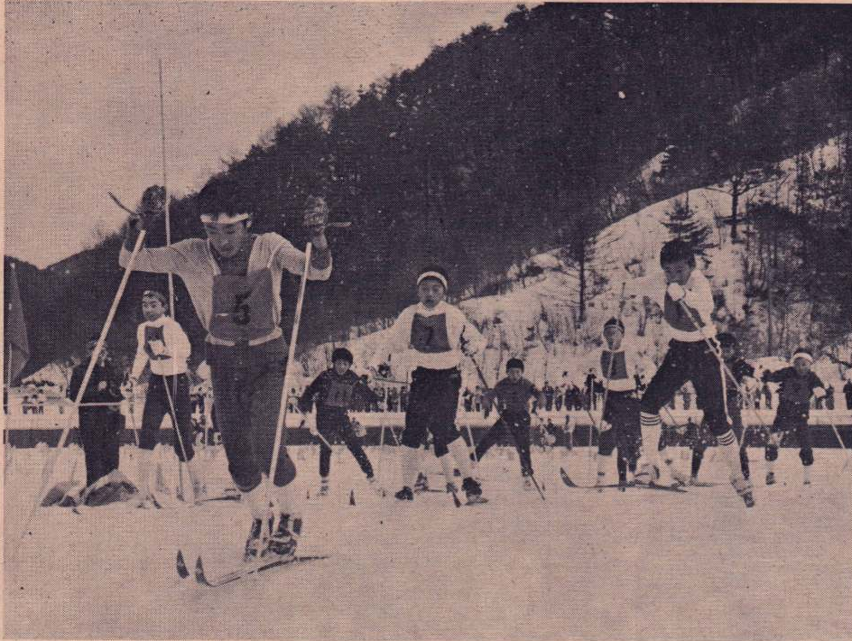
声援を背に日頃の練習の成果を今日ここに...とガンバル選手たち