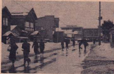
登下校時の交通安全にはとくに注意を

市内随一のマンモス校、大館第一中学校を抱える「一中通り町内会」。昭和37年に神明町から分離、最近は畑地の宅地化が進み、サラリーマン家庭を中心とする住宅地として広がってきました。