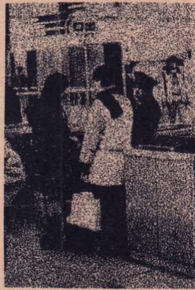
春は「家出の季節」といわれます。家出は非行化への第一歩……要注意

また、少年非行の最近の特色としては、なに不自由ないごく普通の家庭の子供の非行が多いこと。母親が働いていて家を空けている家庭に多いこと。それに、女子による家出と性非行が増加していることがあげられます。少年の非行について言えることは、どんな子供でもある日突然そうした行動に出るのではないということです。ふだんから子供に注意し、非行の「芽」を早く摘みとってしまふことが肝心です。