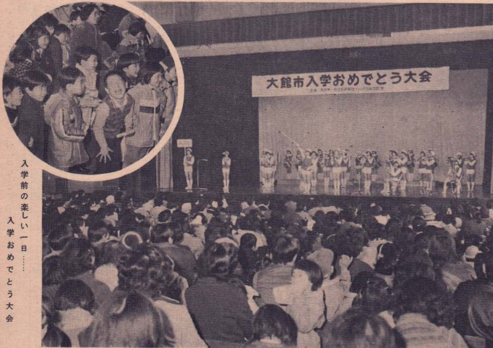
入学前の楽しい一日…… 入学おめでとう大会