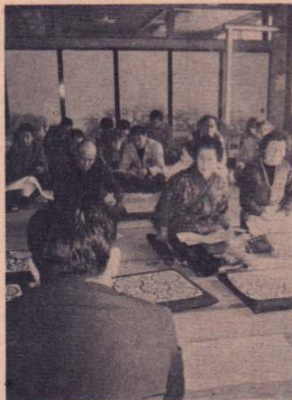
下川谷地区での説明会

この配分面積は原則として三年間固定されるものですが、五十六年度に限り、昨年の冷害を考慮した緩和措置がとられ七百九ヘクタールとされています。