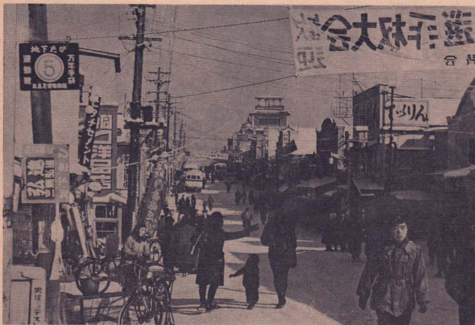
▲市制施行後の大町 ▶現在の大町