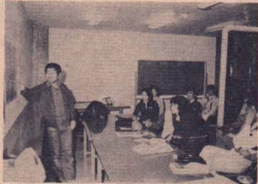
旅行体験談を語り合うのも楽しみのひとつです

健全な旅を通じて青少年の育成をはかろうと、1909年ドイツのリヒアルト・シルマンがアルテナに開設したのが始まりといわれる「ユースホステル」。現在世界53カ国で、日本では昭和26年に日本ユースホステル協会を設立、公営、民営合せて全国560カ所にあります。