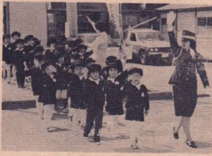
黄色いハネで交通安全を呼びかけ！写真(上)

春の交通安全運動の始まった四月六日、交通指導員や母の会などの皆さんが、大町で黄色いハネを渡して交通安全を呼びかけました。