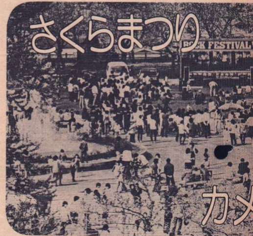
ナイトフィーバー……フォークダンスのつどい