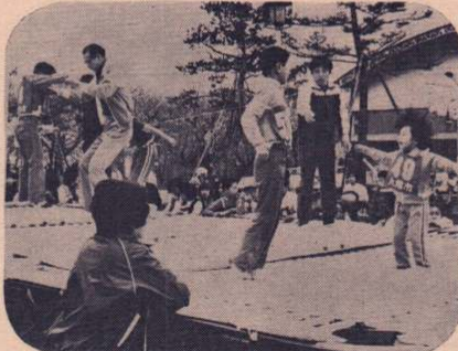
空高く飛びあがれ……トランポリンで遊ぶ