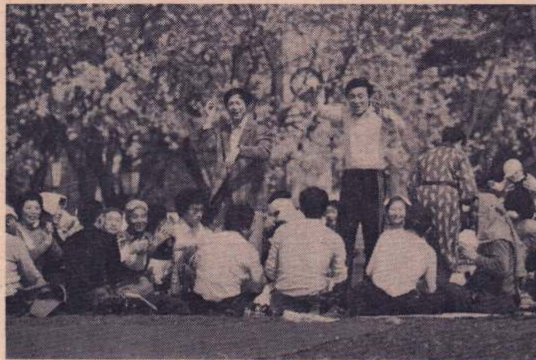
飲めや歌え……い～い気分