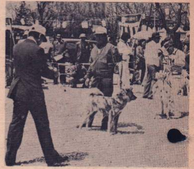
古武士的風格を競う……秋田犬展