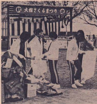
「きったないなあ」東中生徒が桂城公園を清掃