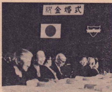
▲金婚式も福祉事務所のしごと

中央玄関を入ると右の奥に、裁判所側から入るとすぐ左に「福祉事務所」があります。福祉事務所では、児童・老人・母子・身体障害者および精神障害者や生活困窮者についての相談や更生、育成を行っているほか、民生児童委員など各種団体や敬老会に関する事、旧軍人の恩給や遺族の保護に関する事などを扱っています。(社会係 保護係については次号でお知らせします。)