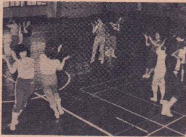
ダンスで汗を流す皆さん

いつまでも若く健康でいよう——をモットーに昭和51年の11月に発足した「金曜トレーニングサークル」は、30代から50代まで幅広い年代層のお母さんたちの健康サークルです。サークル名のとおり、例会日は毎週金曜日、午前10時から2時間余り、中央公民館のスポーツ館を利用し行われています。現在会員は25名、幼稚園児のいるお母さんには、子どもを送り出して迎えに行く間にできる時間帯になっています。