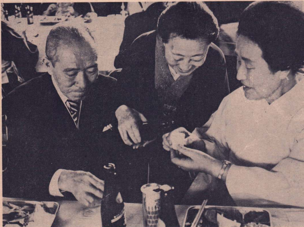
「こんなこともありましたっけ」思い出話に花を咲かせていました。

● 編集と発行 — 大館市役所 (電話) 49-3111 ● 発行年月日 — 昭和56年7月16日 ● 発行日 — 毎月1・16日 広報紙は、行政協力員を通じて全世帯に配布しています。届かなかったり、配布が遅いときは、総務課秘書広報係へご連絡ください。