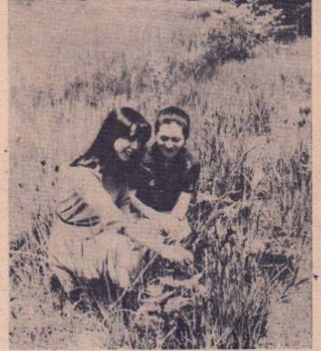
芝谷地のハナシヨウブ