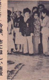
▲金婚式も福祉事務所のしごと

調査対象 — 200人 Aコース (産業施設等) 100人 Bコース (社会歴史等) 100人 回収結果 — Aコース 76人 Bコース 80人