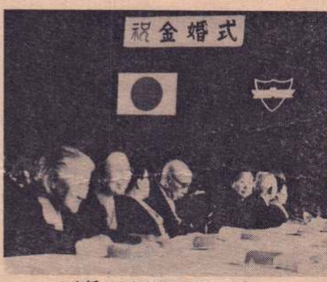
▲金婚式も福祉事務所のしごと

中央玄関を入ると右の奥に、裁判所側から入るとすぐ左に「福祉事務所」があります。福祉事務所では、児童・老人・母子・身体障害者および精神障害者や生活困窮者についての相談や更生、育成を行っているほか、民生児童委員など各種団体や敬老会に関する事、旧軍人の恩給や遺族の保護に関する事などを扱っています。(社会係 保護係については次号でお知らせします。)