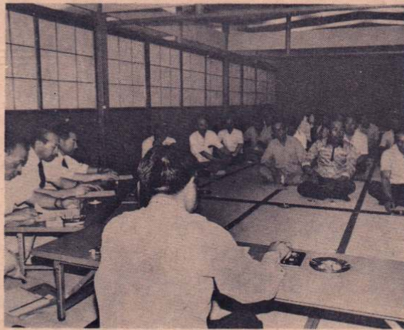
軽井沢五輪荘での市民と語る会

市では、できるだけ多くの市民の皆さんから市政に対するご意見やご要望を聞き、また、市の事情を理解していただくために「市民と語る会」を七月十三日から各地区で開催しています。今回も多く市民の皆さんのご出席をいただき、ご意見やご要望を活発に出していただいています。お誘い合わせのうえご出席くださるようお願いいたします。