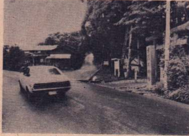
昔ながらのたたずまい

長走風穴は部落から北へ500メートル、国道7号線沿いに進んだところにあります。ここにはゴゼンタチバナをはじめコケモモ、オオタカネビラなど十数種の高山植物