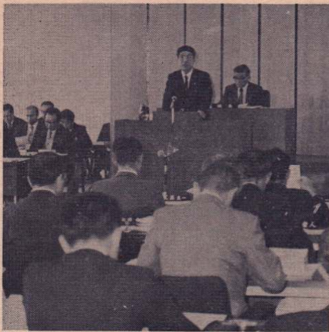
環境浄化都市宣言をする島山市長