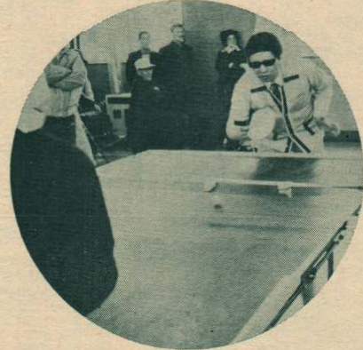
▲盲人卓球大会 当市では初めての盲人卓球大会が、先月十一日、上川沿公民館で開かれ、熱戦が繰り広げられました。同大会は、大館市身障者連合会が主催したもので、身障者の親睦と健康増進が目的。ルールは鈴の入った球を転がして打ち合うもので、参加者は初めての卓球にとまどいながらも楽しんでいました。

以来約二千二百人の児童を送り出し、地域の人々に親しまれてきました。なお現在在籍している九人の児童は、廃校によって四月からは本校方へ毎日元気に通っています。