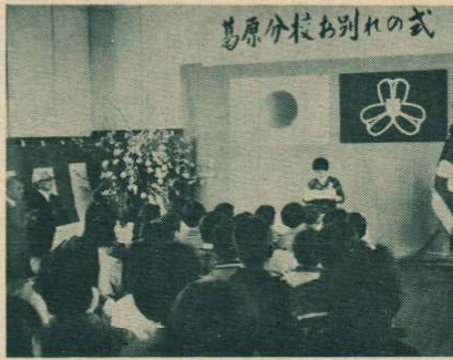
市内で最後の分校となった「成章小学校葛原分校」が先月いっぱいまで廃校となり、そのお別れの式が、先月二十八日、同校体育館で開かれました。同校は明治十一年に創設、

だから、農家の人も喜ばれるようなおいしい米を作り、また私たちがこのお米の味をそこなわないように工夫して食べていくと、この問題は解決できるのではないだろうか。