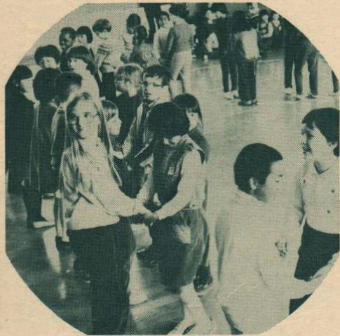
ちよっぴり照れてフオークダンス

在日フランス人学校「リセ・フランコ・ジャポネ・ド・トキョー」の一行が四月十五日から八日間、当市で林間学校を開きました。 県立大館少年自然の家を中心に開設された林間学校には、六歳から八歳の児童六十九人と先生六人が参加し、午前中は正規の授業を、午後にはレオクラブや桂城小学校児童との交流や野外研修などを行いました。 連日の雨で体を持って余していた子供たちは、十九日に行われた桂城小児童との交流会では、玉入れゲームやフオークダンスに大ハッスル。特にフオークダンスでは、しり込みする桂城小の児童を引っ張り出して踊るなど、時間がたつにつれて両校の児童は和気あいあい、ミニ親善の役割を果たしていました。 なお、五月七日には第二陣七十五人が林間学校を開校するほか、七月二十六日には西ドイツのスポーツ少年団員十六人の来市も決まっています。