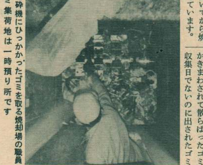
▲燃えるゴミと燃えないゴミは完全に別けてください。

しかし、このゴミを砕く機械にゴミの中に混入されたふんやビニール、金属物などがひつかかり故障が続出し、焼却能力が低下しています。このようにゴミの出し方が、焼却能力に大きな影響を与えています。ご家庭では燃えるゴミと燃えないゴミを完全に区分して、それぞれの収集日に出して下さい。 もしあなたの家の前が ゴミ集荷地だったら と、あなたは考えてみたことがありますか。夏場の悪臭、犬にかきまわされて散らばつたゴミ収集日でないに出されたゴミ ゴミを出す ときのルール ① ゴミは必ず収集日にあわせて出してください。 ② 燃えるゴミと燃えないゴミは完全に別けてください。 ③ 燃えるゴミ—紙類、皮革類、毛・綿・布類(小さく切ってください)、台所から出るゴミ(水分は完全に切ってください)、古材(10センチ角で長さ80センチのもの)など、燃えないゴミ—ふとん、たみ、家具、電化製品、プラスチック、ビニール、発泡スチロール、金属物、空ビン、スプレー類(必ず穴をあけること) ④ ゴミ袋は完全に口を縛ること ⑤ 引越しや庭木のせいでいなど一時に多量のゴミが出たときは、廃棄物処理業者にたのむか、自分で焼却場に運んでください。