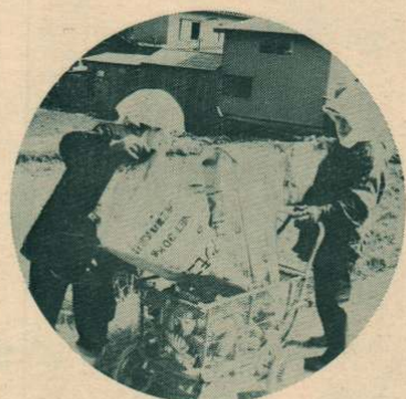
▲わずか50mの間に約100本もの空きカンが… (大瀧の国道で)

近くにクスクスこもなし、一つぐらいいいだらうーと、投げ捨てられる空きカン。その後始末には大変な苦労がいられます。年間百億個といわれる空きカンのすべてが回収されるわけはありませんから、散乱する空きカンの数は、ほう大な量になります。投げ捨てられた空きカンは街や自然の美観を損うばかりでなく、回収・再資源化つまり省資源・省エネルギーの点でもマイナスです。それともう一つ、空きカン公害。それは、わたしたちの公德心に正面から疑問を投げかけています。 家族そろって近くの行楽地へピクニック。さて弁当を広げようと思っても、いたるところ空きカンや紙クズが散乱して、なかなか適当な場所が見つからない。せつかくのピクニック気分が水をさされたという経験は、どなたも一度や二度はあることでしょう。 環境庁の調査によると、空きカンやゴミの散乱場所が一番多いのが「市街地の広場や公園」「河川敷」となっています。空きカンの散乱場所でも最も多いのが「道路」とその周辺で、降ってわいた環境汚染。道路といえば、その近くに住む人たちにとって日常生活の場です。また、田んぼに投げ捨てられる