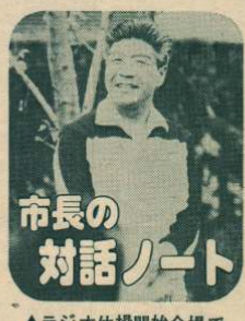
市長の対話ノート