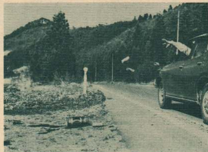
▲「だれも見っていないから」と空きカンをポイ

近くにクスクスこもなし、一つぐらいいいだらうーと、投げ捨てられる空きカン。その後始末には大変な苦労がいられます。年間百億個といわれる空きカンのすべてが回収されるわけはありませんから、散乱する空きカンの数は、ほう大な量になります。投げ捨てられた空きカンは街や自然の美観を損うばかりでなく、回収・再資源化つまり省資源・省エネルギーの点でもマイナスです。それともう一つ、空きカン公害。それは、わたしたちの公德心に正面から疑問を投げかけています。 家族そろって近くの行楽地へピクニック。さて弁当を広げようと思っても、いたるところ空きカンや紙クズが散乱して、なかなか適当な場所が見つからない。せつかくのピクニック気分が水をさされたという経験は、どなたも一度や二度はあることでしょう。 環境庁の調査によると、空きカンやゴミの散乱場所が一番多いのが「市街地の広場や公園」「河川敷」となっています。空きカンの散乱場所でも最も多いのが「道路」とその周辺で、降ってわいた環境汚染。道路といえば、その近くに住む人たちにとって日常生活の場です。また、田んぼに投げ捨てられる