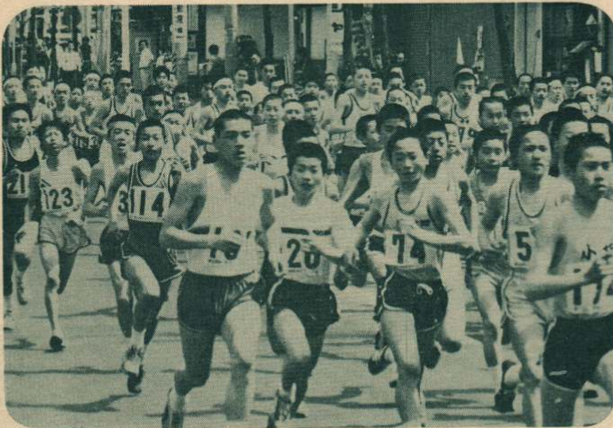
▶今年で三十回目を迎えた山田記念マラソン