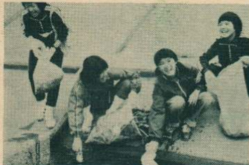
川の中にもゴミが……