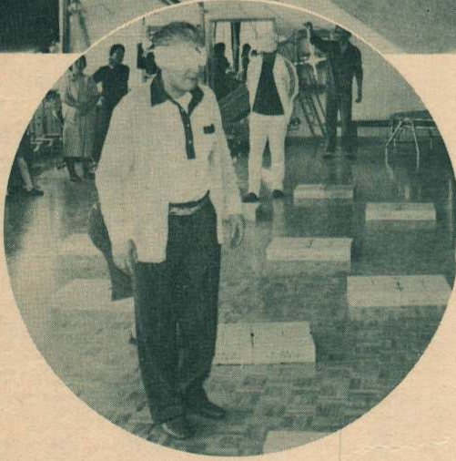
▲耳を澄まして球を追う聴覚訓練