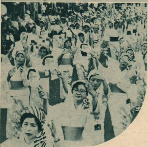
▲一万人おどり—各地区婦人会、小学生などのほか、秋田・鹿角・男鹿のミス観光もおどりに参加