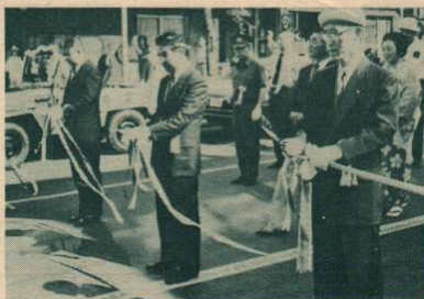
▲テープカット—午後3時、テープカットによって夏まつり行事が開始