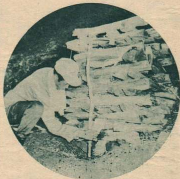
▼大文字焼「点火」—今回は、9人の市民が参加。市長の合図で一斉に点火