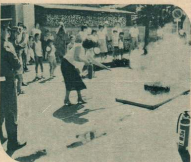
▲消防とチビッコのつどい—消火器の使い方などを実地訓練しました