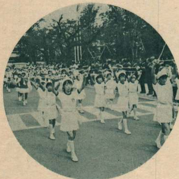
▲桂城公園から大町を回り、文化会館までのパレードには日曜の朝にもかかわらず多くの市民が沿道を埋めました。