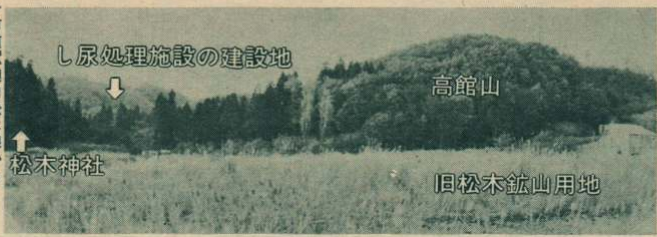
市道釈迦内松木線から建設予定地を望む

大館市と比内町、田代町の一市二町で構成する大館周辺広域市町村圏組合では、「し尿処理施設」を三力年事業の五十九年度完成をめざして建設することになりました。これは、現在使用している「し尿処理場」が老朽化したことにより全面改築するものです。