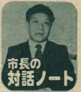
市長の対話ノート No. 59

小畑名譽県民を 静かに送る 今月五日小畑勇二郎氏の急逝を悼み、輝かしい業績をたたえ余りある惜しい業績を葬が、県内外から五千名を超える会葬者の中で、しめやかにとり行われ、永遠の別れを告げました。「民主主義の根拠は地方自治にあり、地方自治の原点は市町村にある」「健康は人生のすべてではないが、不健康な人生ほどつまらぬものはない」あまりにも有名な先生の言葉であり、あらためて思いおこしているところです。もの静かな動作、やさしい眼差しの中にも暖の奥からキラリと光る瞳孔、まさに自己には厳しく、他人には慈愛を、そんな先生でした。私は何度か激論をたたかわれたことがありますが、劣使の関係をたから当然のことです。大人と子供の口論みたいなものであったかもしれせん。総論と各論、数字をあげての説得力には感服させられたものでした。