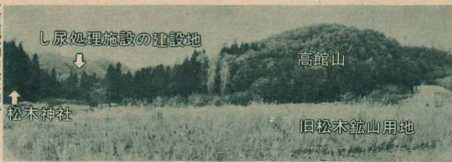
市道釈迦内松木線から建設予定地を望む

大館市と比内町、田代町の一市二町で構成する大館周辺広域市町村圏組合では、「し尿処理施設」を三力年事業の五十九年度完成をめざして建設することになりました。これは、現在使用している「し尿処理場」が老朽化したことにより全面改築するものです。