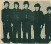
大館工業高校スキー部

両校スキー部は、たゆまぬ努力と研鑽により全日本スキー選手権等において輝かしい成績を残され、こと