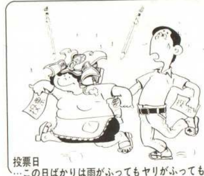
投票日...この日ばかりは雨がふってもヤリがふっても...

投票所が変わります 今回の選挙から御成町方面の投票所が二カ所から三カ所になりますのでご注意ください。