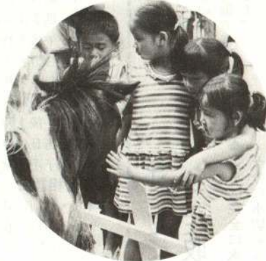
▲子馬とチビッコたち