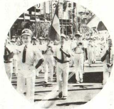
▲ゴールデンパレード