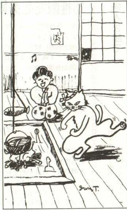
絵・田村純一さん

のとてカタカタ震えた。するとチャコが「わ、踊るんておめえ、はやせじや」と言った。嫁ッコは、恐る恐る猫を見ながら「わ、なも知らね」と答えた。チャコは「わ、教えるんて、おめえはやせじや」と言って踊りだした。しゅちゃんころばし、なつちやがれ、なつちやがれ、なつちやがれ、なつちやがれ…… 嫁ッコは、チャコの踊りをしはばらく見つめていたが、やがてその歌につられて歌いだした。しゅちゃんころばし