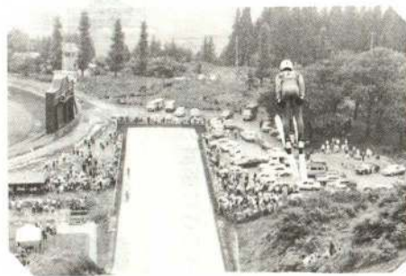
▲今年度で全面完成する長根山運動公園

59年度は、厳しい財政状況の中で、「給合開発計画」に基づいた5つのまちづくりの予算を組み、「活力のある住みよいまちづくり」を目指していきます。今年度予算の中から主な事業をお伝えします。