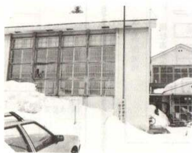
▲改築される花岡公民館